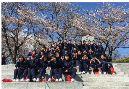
[天童・舞鶴山公園にて：8組]

1学年で新入生研修会が行われました。場所は「山形県青年の家(天童市)」で18日(火)に実施しました。ちょうど舞鶴山公園の桜も開花し天候にも恵まれた研修会になりました。